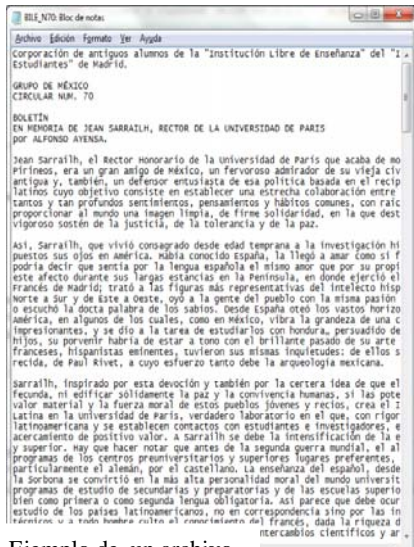
Ejemplo de un archivo

La metodología de digitalización se refiere a cuestiones técnicas. El escaneado se ha llevado a cabo con una resolución de 400 ppp, creando archivos imágenes en tiff , que serán la copia de conservación permanente. A partir de estos archivos, se trabajarán los otros formatos de salida con sus diversas funciones: jpg para imágenes de visualización individual en web, archivos en formato pdf multipágina para el estudio de los boletines completos, archivos en formato txt para la recuperación de texto en formato universalmente accesible y ficheros doc para la edición de ese texto.