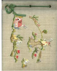
Figura 2: capa do álbum de 1958 (cota A1)