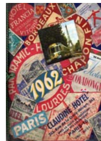
Figura 5: Diário da viagem a Paris em 1962