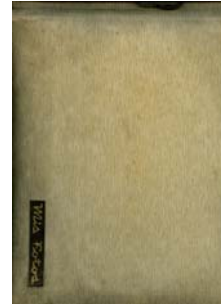
Figura 3: capa do álbum de 1962 (cota A2)