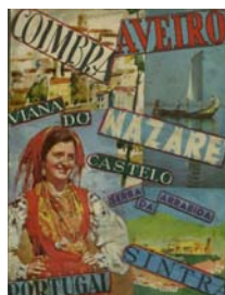
Figura 6: Caderno-resumo de todas as viagens