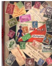
Figura 4: Diário da viagem a Lourdes em 1958