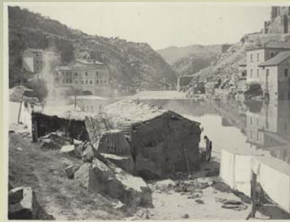
Toledo. Cabaña de pescadores junto al Puente de Alcántara.