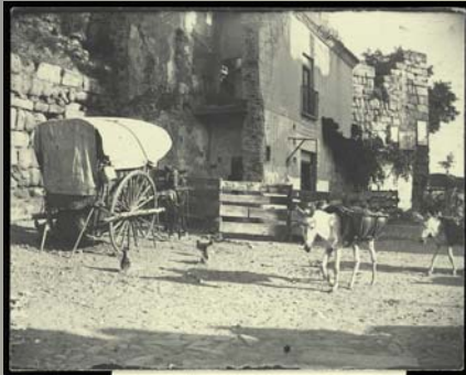
Toledo. Casa que ocultaba la Puerta de Alcántara.