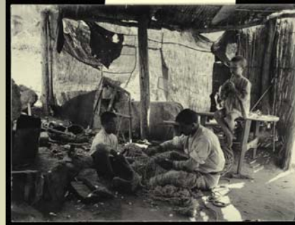
Escena de trabajo en una cabaña de pescadores levantada junto al Puente de Alcántara.