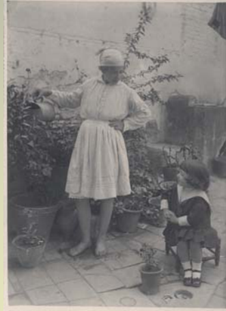
Toledo. La pequeña Antonia, hija del pintor, en casa de la joven sirvienta conocida en familia como "la Petrilla". Fondo "Pedro Román Martínez" D.P.T., ROM945