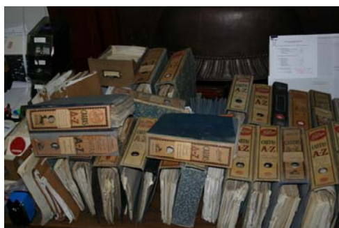
Fig. 7. Fondo documental del Instituto “Rodrigo Caro” de Arqueología, localizado en el 2005 un almacén de edificio de Medinaceli

Este problema de dispersión o abandono se puso de manifiesto sobre todo durante el proceso de unificación de los distintos institutos de humanidades al actual CCHS, ya que surgió la necesidad de identificar, recopilar y trasladar los fondos a su nuevo destino en la calle Albasanz. Existía un claro riesgo de pérdida de patrimonio documental en el traslado que debía acometerse y para ello debía proponerse y llevar a cabo una metodología de trabajo que asegurará la salvaguarda de dicho patrimonio, con especial atención a la documentación de carácter histórico aplicando criterios documentales de valoración y selección.