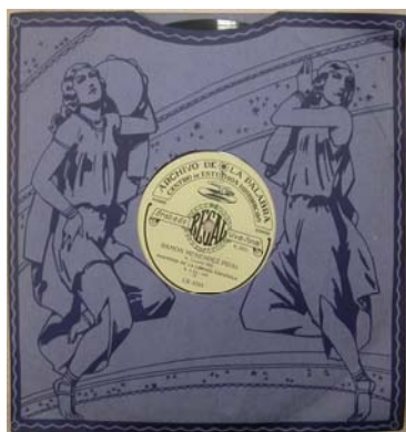
Fig. 5. Disco de pizarra del Archivo de la Palabra. Grabación de la voz de Ramón Menéndez Pidal.