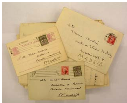
Fig. 2. Documentación diversa del fondo Teresa Andrés. Archivo del CCHS (916)