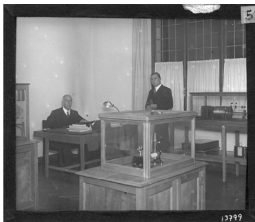
Fig. 4. Laboratorio de Fonética del Centro de Estudios Históricos. Tomás Navarro Tomás, sentado, junto a uno de sus colaboradores. Archivo Fotográfico del CCHS (f0855)

El Archivo de la Palabra dirigido por Tomás Navarro Tomás, fue creado en 1930 como una nueva línea de trabajo de la sección de Filología del Centro de Estudios Históricos (1910-1939), destinada a reunir los materiales sonoros que proporcionan información sobre lenguaje y música popular, especialmente relativos a la cultura hispánica. Las dos personas encargadas directamente del Archivo de la Palabra y de las Canciones Populares fueron el experto en fonética Tomás Navarro Tomás y el folklorista asturiano Eduardo Martínez Torner.