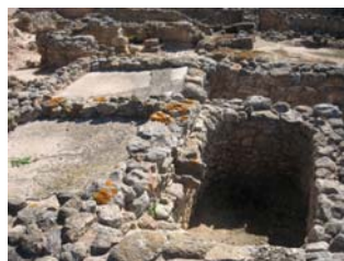
Lagar, Doña Blanca, siglos IV-III a.c.