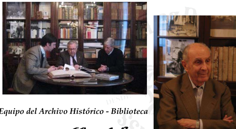
Equipo del Archivo Histórico - Biblioteca