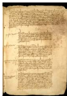
Ordenanza de la uva pasa y vendimia. Año 1483