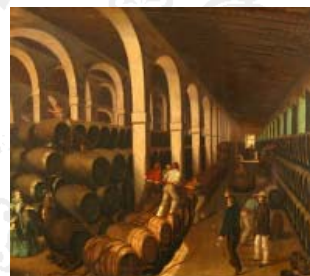
Trabajos en la Bodega