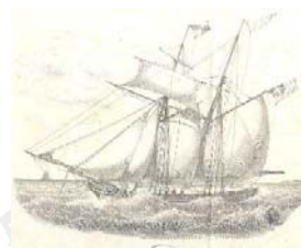
Transporte Marítimo siglo XIX