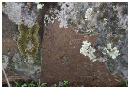
Grabado pastoril de Serradilla del Arroyo (Salamanca).