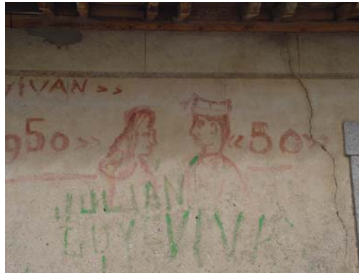
Escritura de quintos. Valdenebro de los Valles (Valladolid).