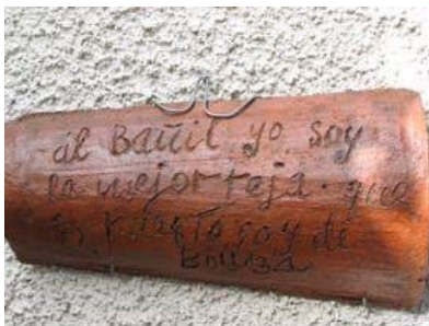
Teja de Puerto Seguro (Salamanca).