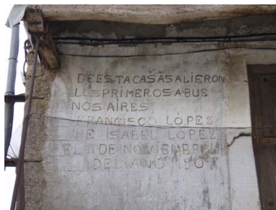
Escritura de emigrantes. La Vidola (Salamanca).