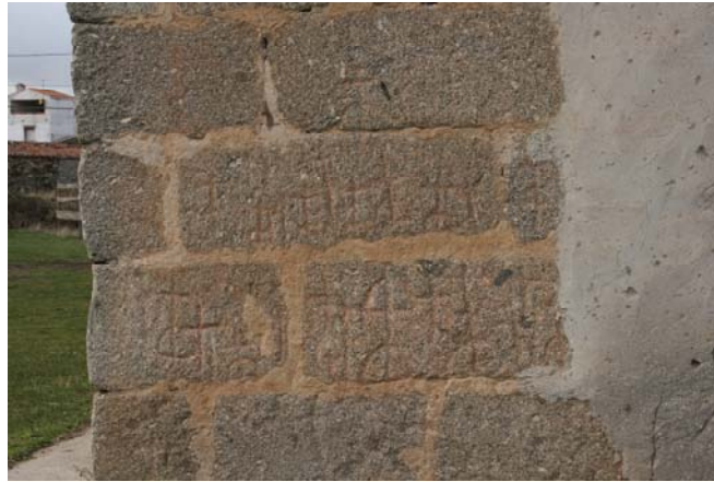
Ortigosa del Río Almar (Ávila).