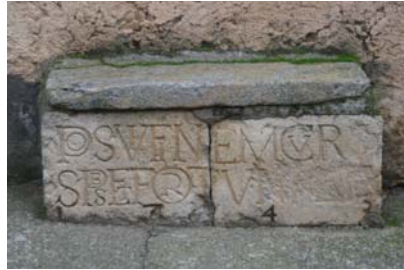
Hinojosa de Duero (Salamanca).