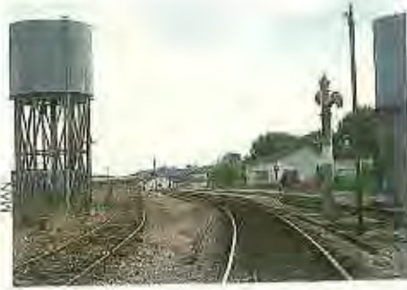
La actual renovación de vía ha llegado hasta La Bazagona.

En la provincia de Cáceres efectuaba parada en Hervás, Plasencia, Palazuelo, Cañaveral y la propia capital, proporcionando enlace directo entre estas poblaciones y entre otras las ciudades de Sevilla, Zafra, Mérida, Salamanca, Zamora, Astorga, León, Oviedo y Gijón.