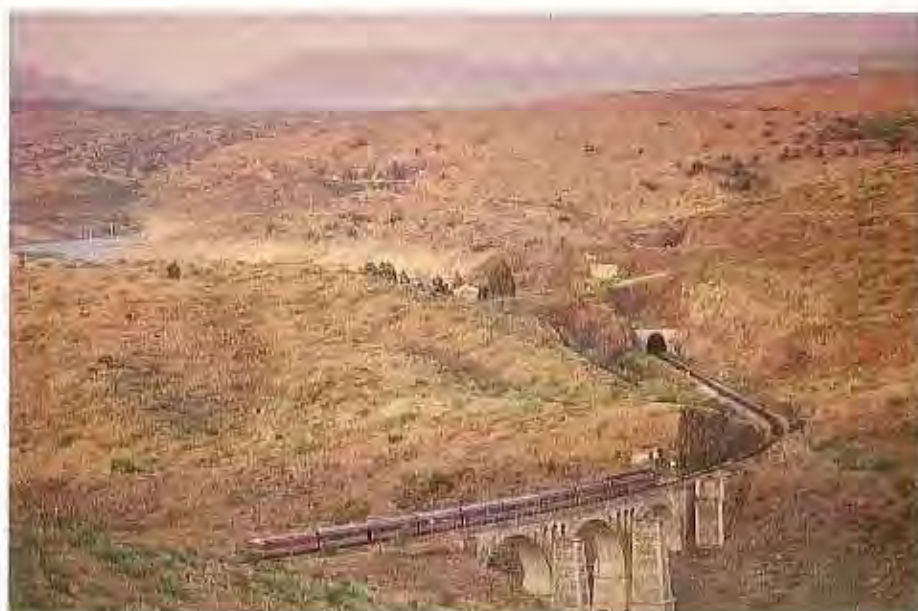
El «Extremadura Talgo» sobre el puente de Villaluengos. Al fondo la estación de Río Tajo.

El «Ruta de la Plata», que ya habían iniciado su singladura con material Taf, unía Sevilla con Gijón a través de Extremadura, Castilla y León en una relación diaria. Invertía un total de 15 h 30 m en un recorrido de 965 km.