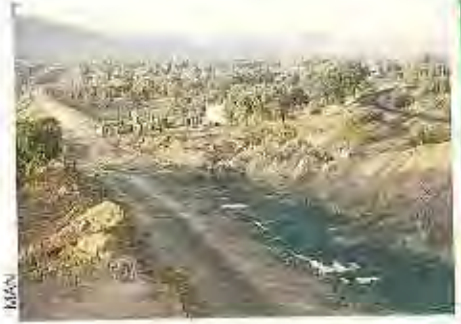
Aspecto que presentan las obras de la variante de Palazuelo a Mirabel.

El número total de agentes que prestan servicio en la provincia es de 290, estando asignado el mayor contingente a Instalaciones Fijas (121 agentes, el 41% del total) seguido de