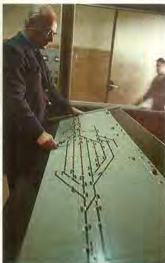
Enclavamiento eléctrico de la estación de Cáceres.

vincia de Cáceres son Navalmoral de la Mata, Casatejada, Plasencia-Ciudad, Mirabel, Cañaveral, además de la propia capital. La entrada a la estación de Plasencia, con la correspondiente inversión del sentido, más el tiempo invertido en recorrer dos veces el trayecto, aunque permite enlazar directamente esta población, supone un incremento en el tiempo del recorrido.