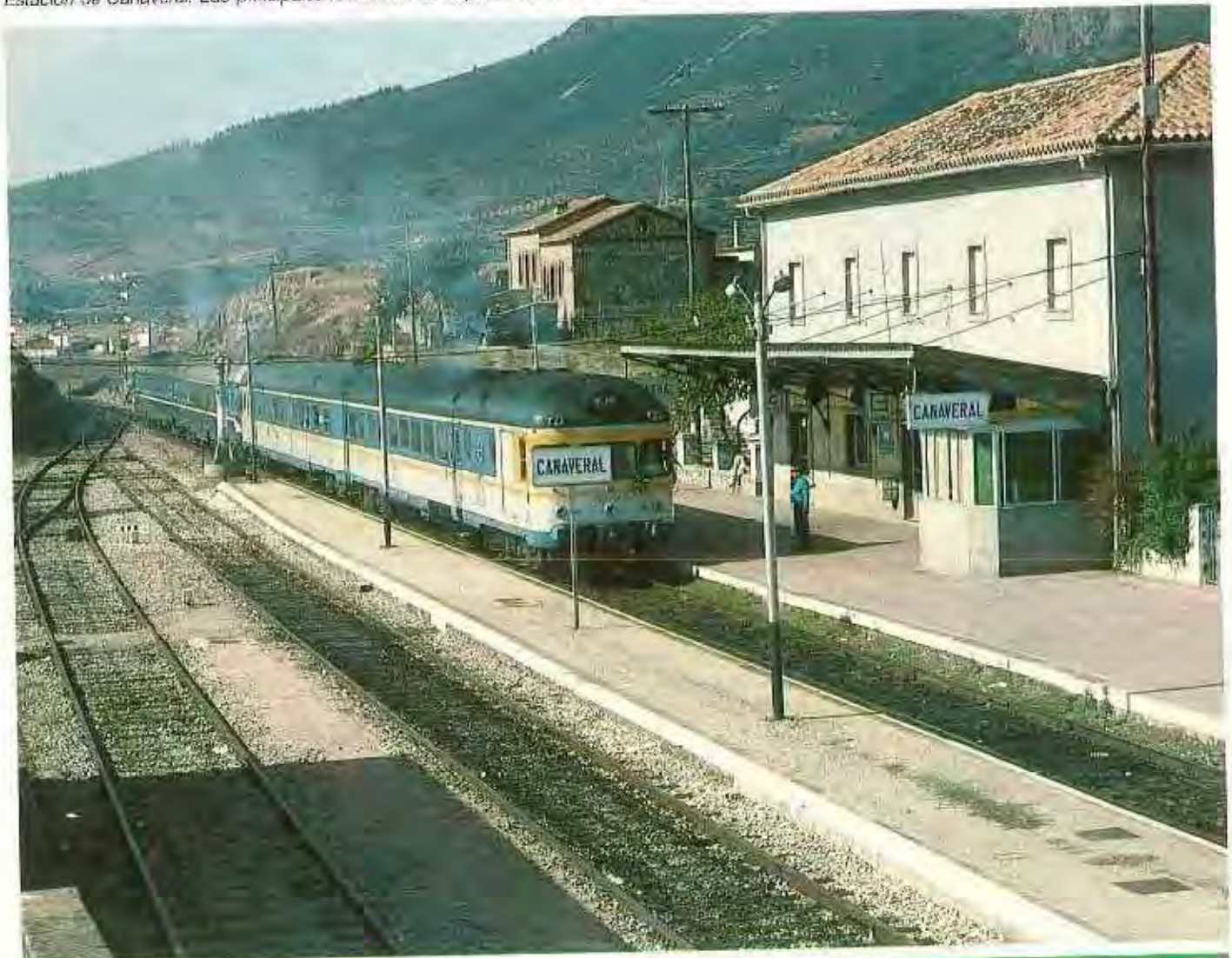
Estación de Cañaveral. Las principales relaciones de la provincia están orientadas a Madrid.

El principal centro de trabajo por número de empleados es la capital de la provincia con 156 agentes (el 53% del total), seguido de Plasencia (35 agentes) y Valencia de Alcántara (22 agentes). En estas tres poblaciones se agrupa el 73% de los trabajadores de Renfe en la provincia, distribuyéndose el resto (77 agentes) en diez dependencias.