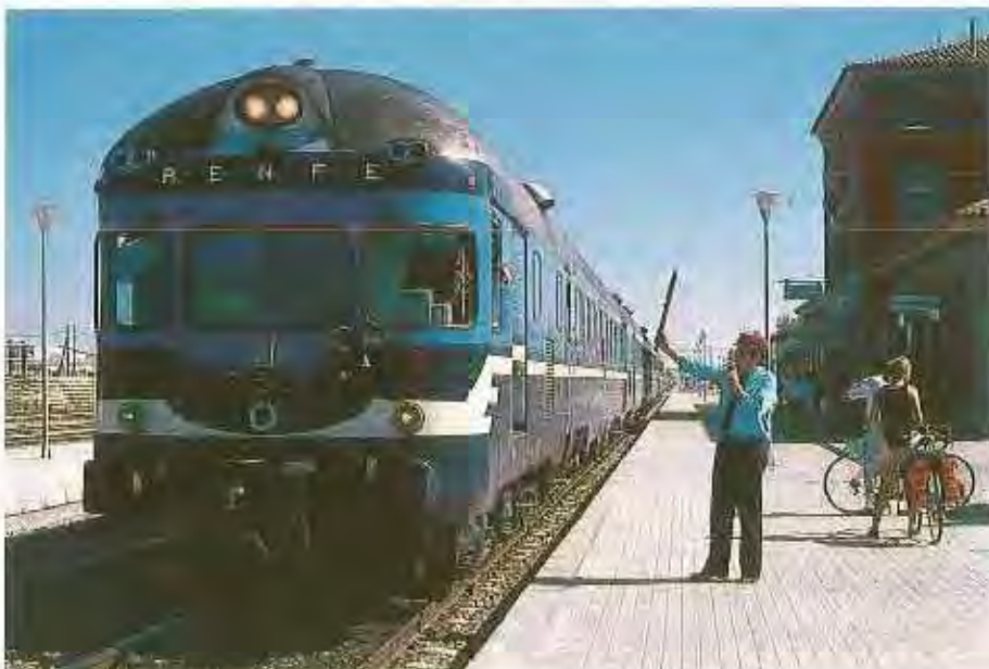
El Ter Madrid-Lisboa a su paso por Navalmoral de la Mata.

Otro enlace de calidad con Madrid se facilita con la rama Barcelona-Cáceres del Rápido «Sierra de Gredos», prolongación desde el 29 de mayo de 1988 del tradicional Rápido diurno Barcelona-Madrid. Proporciona una relación de tarde entre Madrid y Cáceres y de mañana en sentido contrario, invirtiendo en el trayecto 4 h 48 m. Las paradas que efectúa en la pro-